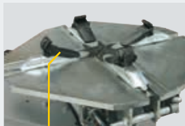
G800A98 → 22" (4 x kit) G800A6 → 26" (4 x kit)