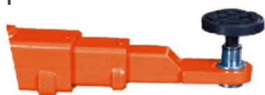
Braços com 3 extensões (615-1150mm)