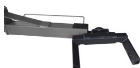
Suporte de rodas